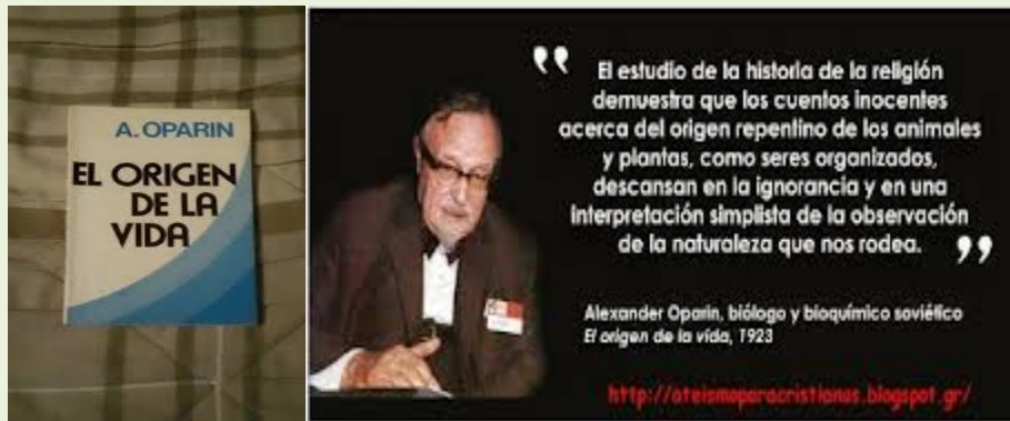
Alexandr Ivánovich Oparin

Fue un biólogo y bioquímico soviético que realizó importantes avances conceptuales con respecto al origen de la vida en el planeta Tierra. Vivió entre 1840 y 1980.