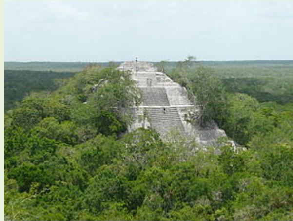
Calakmul. Mundo Maya

Naturaleza y arqueología se muestran unidas en su máxima expresión de grandeza, forma al unirse con las reservas adyacentes, el segundo pulmón natural más grande del continente y la mayor reserva ecológica tropical de México con una extensión de más de un millón de hectáreas. Alberga alrededor de 86 especies de mamíferos (jaguar, puma, ocelote, tigrillo y leoncillo, oso hormiguero, mono araña, mono aullador, tapir...). También es el hogar de unas 282 especies de aves, 50 especies de reptiles, 400 de mariposas y 73 tipos de orquídeas salvajes.